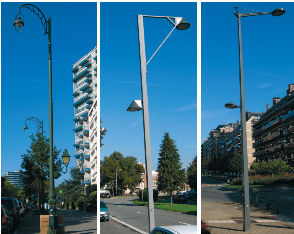
Verlichtingspaal met twee armaturen: een voor het trottoir en een voor de rijbaan.

Hoe hoger de verlichtingspaal of de bevestigingsarm, des te groter het verlichte oppervlak en des te lager de verlichtingssterkte. De hoogte kan gaan van zeer laag (4 tot 5 m) tot hoog (6 tot 9 m) voor straatverlichting. Voor aangepaste verlichting, bijvoorbeeld van het trottoir en de rijbaan, kunnen verlichtingspalen met twee armaturen op verschillende hoogten worden aangebracht.