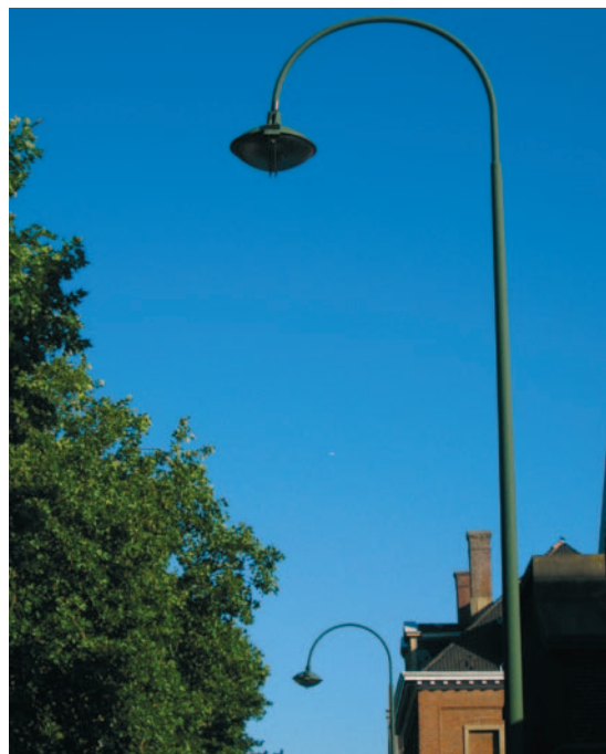
Lichtarmatuur van het type Tweede Regiment Lansierslaan.