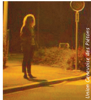
Geen E_{sc} : slecht gerichte verlichting.