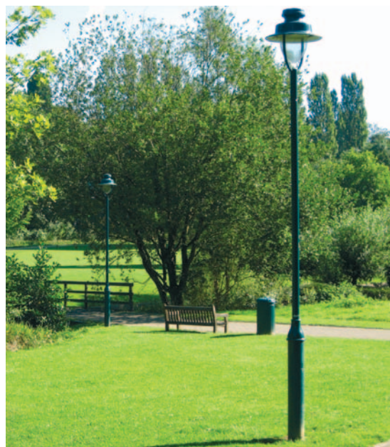
Lichtarmatuur voor wandelwegen in het Koning Boudewijnpark.