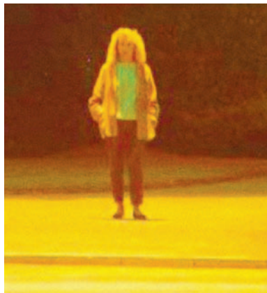
Zwakke E_{sc} : "vlak" gezicht.